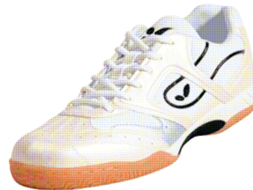
Radial TB – buty dla Mistrzów.

T.I. : Radial Run zostały zaprojektowane z myślą o zawodnikach tenisa stołowego, którzy potrzebują butów do treningu ogólnorozwojowego i biegania w terenie kilka razy w tygodniu. Nie są one przeznaczone dla profesjonalnych biegaczy. To jest domena innych producentów sprzętu sportowego.